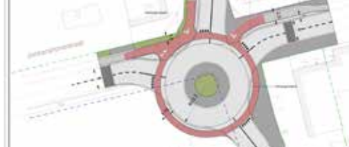
Komt de rotonde er? p. 3