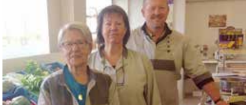
Meer dan 125 jaar dorpswinkel